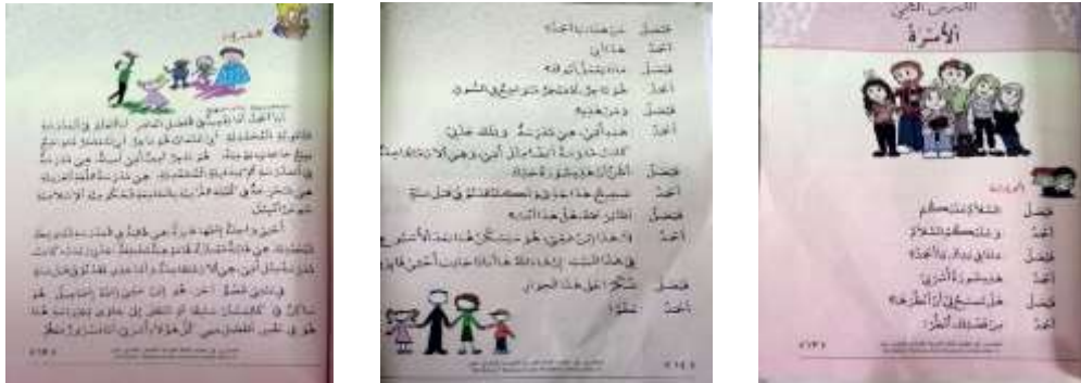
Gambar III: Bab II al-Usroh

Percakapan dalam gambar III diatas terdapat pada halaman 13-14 bab al-Usroh . Percakapan ini mengandung unsur Subordination (Penomorduaan) yang menggambarkan sebuah percakapan yang hanya dilakukan oleh dua orang, sedangkan jika dilihat dari judulnya yaitu al-Usroh , semestinya perempuan juga dapat dimasukkan menjadi tokoh dalam percakapan tersebut. Sebab struktur anggota keluarga tentu tidak hanya laki-laki, tetapi terdapat anggota perempuan didalamnya; ibu, nenek, adik perempuan, kakak perempuan dan lainnya.