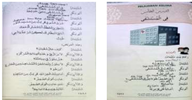
Gambar VII: Bab V Fii al-Mustasfa

Gambar VII di atas terdapat pada halaman 47, jika dilihat dari gambar di atas mengandung unsur Subordination (Penomorduaan) yang menggambarkan sebuah percakapan dimana hanya laki-laki yang melakukannya, perempuan tidak diikutkan dalam percakapan tersebut, karena dianggap perempuan hanya dapat melakukan pekerjaan domestik.