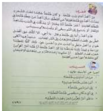
Gambar VIII: Bab VIII al-Rihlah

Cerita pada gambar diatas terdapat pada halaman 79, yang menceritakan tentang dua anak laki-laki yang akan menghabiskan liburan dengan mendaki gunung dan akan mendirikan tenda disana. Pada cerita tersebut tidak didapati seorang perempuan, menunjukkan bahwa perempuan dianggap lemah, hal ini mempersulit perempuan untuk mengembangkan potensi diri. Jika dilihat dari cerita tersebut menunjukkan unsur Stereotype (Citra Baku).