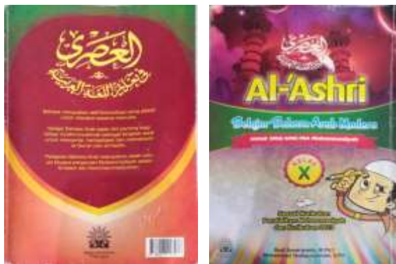
Gambar I: Cover Buku Bahasa Arab Al-`Ashri

Buku ini terdiri atas 8 Bab, pada masing-masing bab terdiri dari al-Mufrodah, al-Muhadatsah, al-Qoidah, al-Tamrinat, al-Qiro`ah . Bab 1 hingga bab 4 digunakan sebagai materi semester gasal, sedangkan bab 5 hingga bab 8 digunakan sebagai materi semester genap, sebagaimana dalam tabel berikut: